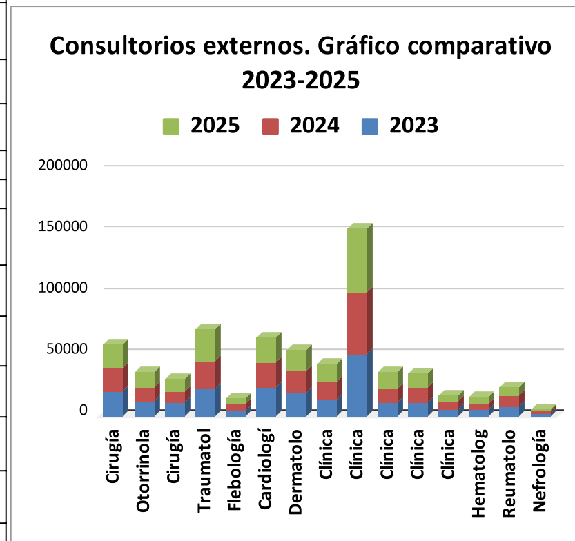
Consultorios externos. Gráfico comparativo años 2023-2025

Fuente: Hospital Municipal Héctor Dagnillo. Marcos Paz SSSL: Sala de Situación de Salud Local 2025 Municipio de Marcos Paz